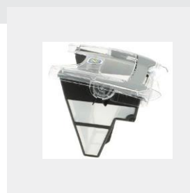
POJEMNIK FILTRA (3 L)