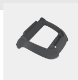
PODSTAWA Pod zasilacz